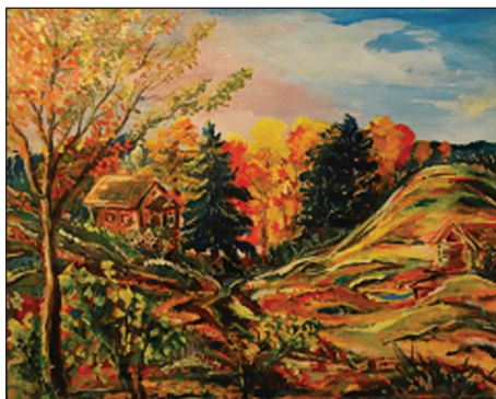
Сергей Соловьёв «Осень в деревне»